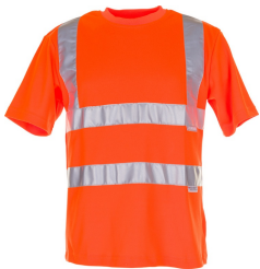
uni orange 2095