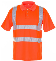
uni orange 2091